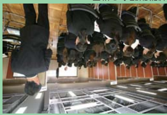
就職説明会の様子

ペット業界就職説明会はペット業界の未来を担う皆様へ、就職先候補を見つかるためのマッチングイベント。全国ペット協会加盟の優良店が多数、出展いたします。家庭動物管理士を取得・維持を希望している方へ、全国ペット協会が主催するペット業界就職説明会にご参加いただけます。