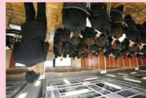
家庭動物管理士の様子

ペット業界就職説明会は、ペット業界の未来を担う皆様か、就職先候補を見つけたためのマッチングイベント。全国ペット協会加盟の優良店が多数、出展いたします。 家庭動物管理士を取得・維持をしていただく、全国ペット協会が主催するペット業界就職説明会にご参加いただけます。家庭動物管理士資格保持者、ZPK認定校(在学生)のみが参加可能な限定イベントです。